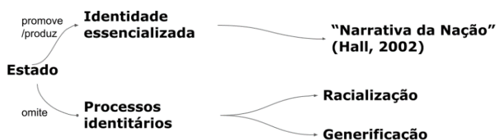
Figura 1: Sistematização do argumento do Ensaio Teórico

Visto isso, consideramos os seguintes objetivos teóricos: (1) demonstrar como o Estado-nação moderno se utiliza de uma perspectiva essencializadora de identidade; e (2) evidenciar, com base em processos de racialização e generificação, como o Estado-nação moderno omite processos identitários que formam suas instituições. A partir destes objetivos temos o seguinte desenho teórico: